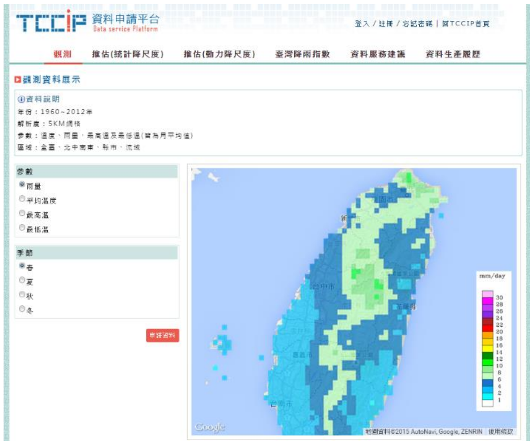
圖二、TCCIP資料申請平台資料展示頁面