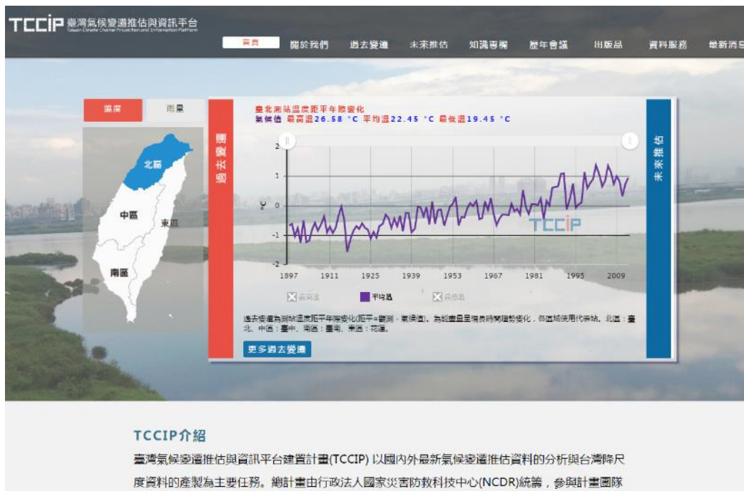
圖三、新版臺灣氣候變遷資訊平台首頁畫面